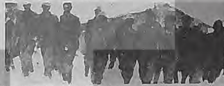
Aşkale'de yaşanan grev. İşverenin Kapatılması Kararına itirazın üretim devam ettirmek için gerçekleştirildi

1978 Temmuzunda 26 gün süren ikinci grevi yaşadı Yeni Çeltek. İlk grevden çok daha çoşkuyla ve örgütlü geçen ikinci grev sırasında emekçi halk maddi ve manevi her türlü desteği gösterdi. Yeni Çeltek, işyeri komitelerinin ilk kez uygulandığı ve hayata geçtiği yer oldu. Oluşturulan konsilyer, toplu sözleşmenin taslağının hazırlanmasında, sözleşme görüşmelerinin sürdürülmesinde, imzalanmasında, sözleşmenin uygulanmasında, eğitim çalışmalarında grev örgütlenmesine kadar her aşamada kendilerini düşen görevleri yerine getirmişlerdir.