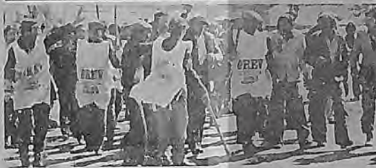
Yeni süren Hekimhan Grevi. İşçi sınıfının kararlılığına sücel bir örnek

70'li yıllarda işçi sınıfı hareketi niteliksel bir sıçrama göstermiş ve özellikle 1976 yılından sonra gerçekleştirilen grevlerde ekonomik taleplerin yanında demokratik talepler ağırlık kazanmıştır. Bu dönemdeki grevlerin önemli bir özelliği siyasi önderliğin oynadığı roldür.