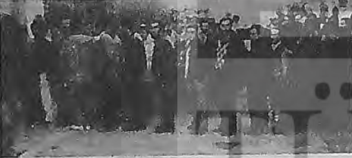
Soma SSK Hastanesi önünde "Vizite Eylemi".