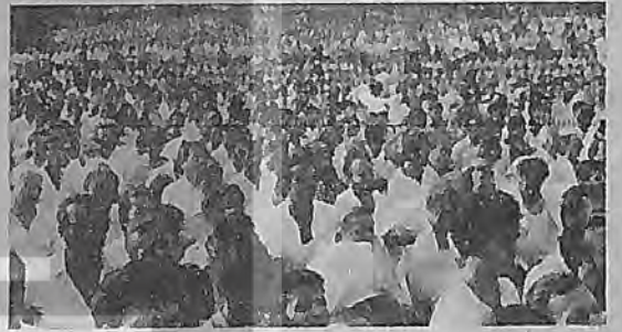
137 gün süren demir-çelik grevi çelik işçisinin mücadele tarihimde önemli bir deneyimdir

sunda gözçülerin yanına kimsenin, basın bile yaklaşılmadığı, fotoğraflarını çeken gazetecilerin filmlerini alındığı durumlar yaşandı. İşçiler grev boyunca polislin fiili baskısı ile karşı karşıya kaldılar. Grev nedeniyle yapıyı yarıda bırakılan PTT telefon santralında 150 kadar kapsama dışı mühendis zorla çalıştırıldı. Boyutları NETAŞ'ı aşan grev ülkenin demokrasi mücadelesi içinde yerini aldı. 93 gün sonunda bitiren grevin ardından büyük bir işçi kıymı başlandı. İşten atılmalar öyle boyutlara ulaştı ki işyerinde %90 üyesi bulunan Otomobil-İş'in üye oranı %51'in altına düştü.