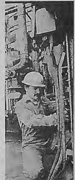
"Kapatırız" tehdidine maruz kalan MTA işçileri haklarını arıyorlar.

İŞÇİLERİN EMEKÇİLERİN YAŞAMINI GÜNDEM GÜNE AĞIRLAŞTIRAN MEVCUT POLİTİKALARA İDAMLAMAK İZİNİ VERMEYEN SAVAŞ SAĞAŞI VE SAVASHALI POLİTİKALARININ KARŞISINDA GREVÇİ İŞÇİLERİN SAĞINDA YER ALDIĞIMIZI VE GREVDEKİ COCA-COLA İŞÇİLERİNİ DESTEKLEMELİK İÇİN COCA-COLA ÜRÜNLERİNİ BOYKOT ETTİĞİMİZİ KAMUYUNA DUYURUYOR. DEMOKRASİDEN YANA TUM KURULUS VE KİŞİLERİ COCA-COLA URUNLERİNİ BOYKOT ETMEYE ÇAĞIRIYORUZ!