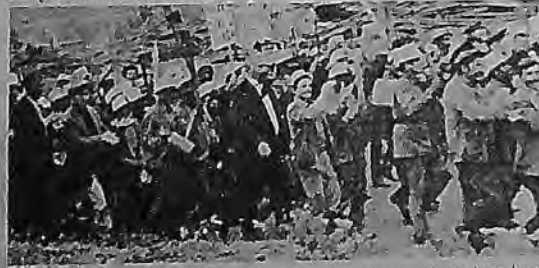
Yeni Çeltek grevinde ilk kez kendilerini yöneten işçiler (Komitelerin başlarıyla hayata geçirildi)

Hekimhan grevinde zafer yalnızca maden işçilerinin değil ve fakat tüm Hekimhan halkının, esnafın, köylülerindir. 16 ay süren kararlı grev süresinde tüm Hekimhan örnek bir örgütlülük sergilemiştir