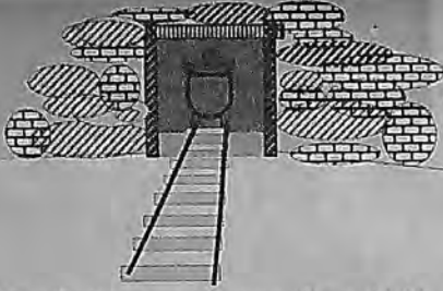
Türkiye Taşkömürü Kurumu (Zonguldak) 800 Milyar TL. zararda (1990 ilk 6 ay)