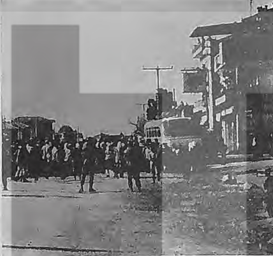
24 gün süren Tarih Direnişi bütün İzmir'i sarmıştı

1980 yılının ilk aylarında yaşanan Tarih Direnişi, Grev olarak değerlendirilememesine rağmen ülkemiz işçi sınıfı tarihinde önemli bir dönüm noktasıdır. Tarih'te yaşanan direniş bütün İzmir'i sarmıştır.